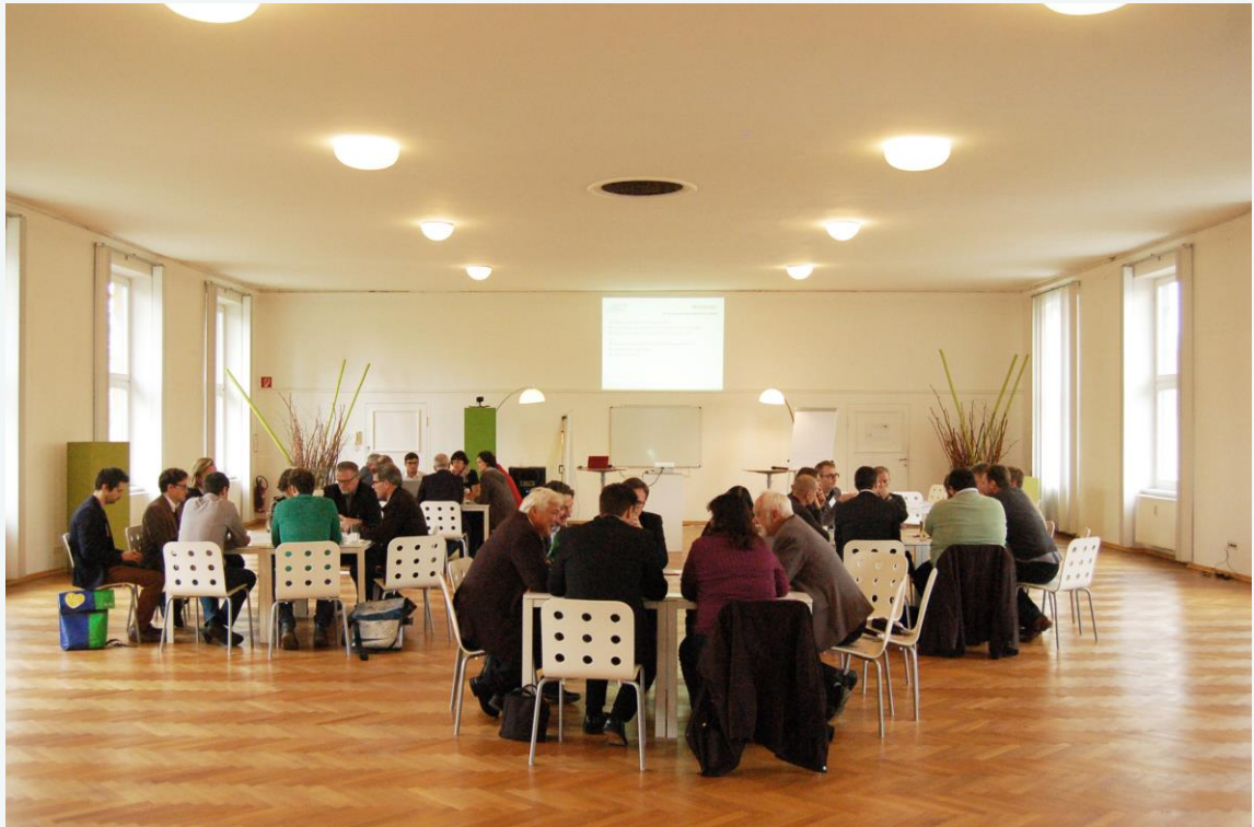
Immagine 10: Alcuni stakeholder lavorano assieme su una sfida per la città di Graz.

Perché pensi che la collaborazione di attori provenienti da diversi settori potrebbe essere importante nel processo di pianificazione della città?