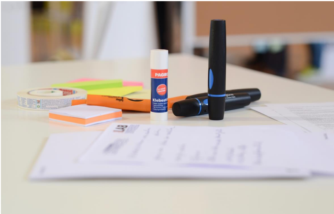
Immagine 1:

Nel definire il contenuto del Living Lab si può far riferimento alle seguenti domande: