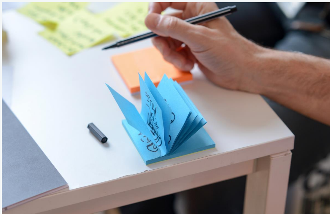
Slika 1: Nikolaus Kurnik

Šta visok kvalitet života znači za vas? Napravi listu aspekata za koje smatraš da su najbitniji!